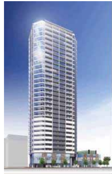
※完成予想図は変更されることがあります。